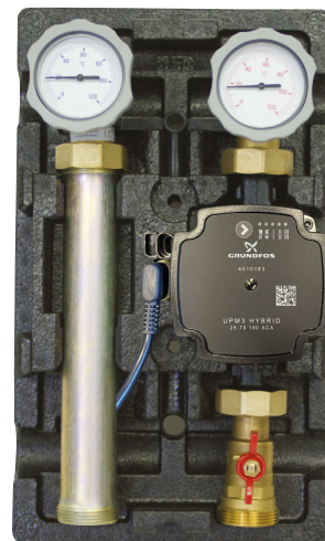
Obj. číslo M66811.36 8 870,- Kč / 331,00 EUR