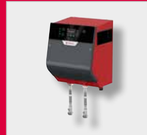
FlexFiller Mini Täyttöyksikkö