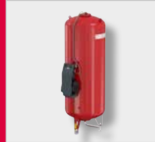
Flexcon MK-U Paisunta-automaatti*