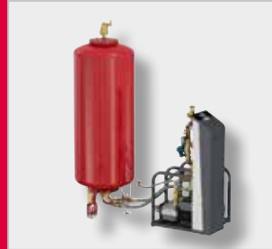
Flamcomat MP G4 Paisunta-automaatti