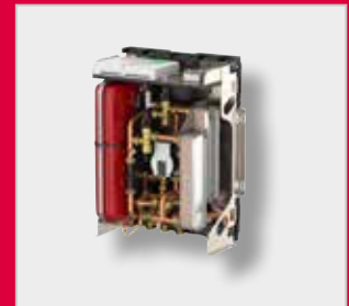
LogoEco Dual G2 Lämmönsiirrinyksikkö