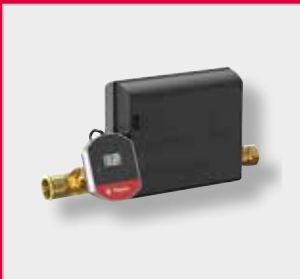
Flexcon PA Täyttöyksikkö