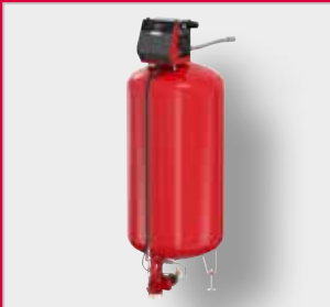
Flamcomat G4 MK-C Paisunta-automaatti