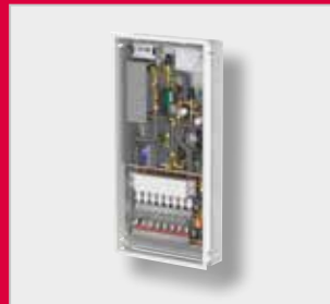
LogoMatic G2 Lämmönsiirrinyksikkö