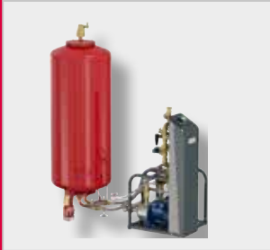
Flamcomat G3 Paisunta-automaatti*