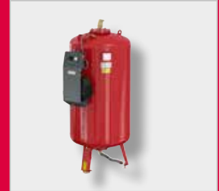
Flamcomat MK-U G4 Paisunta-automaatti