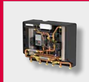
LogoEco G2 Lämmönsiirrinyksikkö